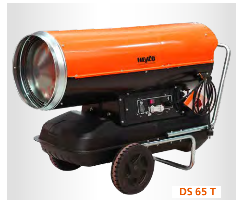
DS 65 T