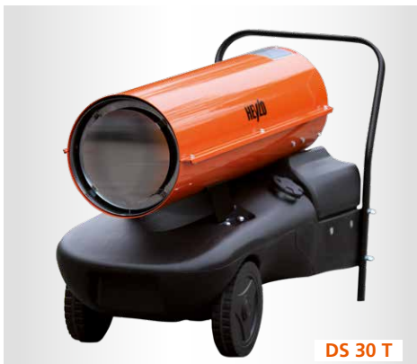
DS 30 T